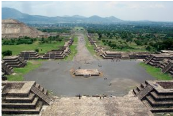
Restos arqueológicos de Teotihuacan