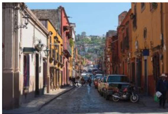
San Miguel de Allende