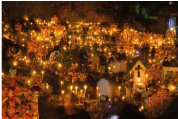
Isla Janitzio en día de muertos

Llegada a ciudad de origen. Fin de nuestros servicios.