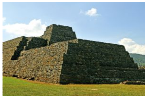
Restos arqueológicos de Tzintzuntzan