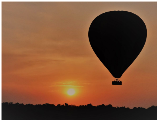
Masai Mara Globo