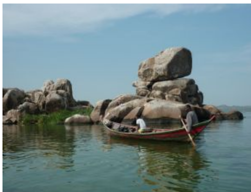
Pescadores en el Lago Victoria