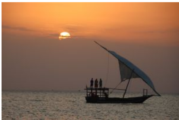
Sublime atardecer en Zanzibar

Gozaremos de una estancia que combina las comodidades que ofrece nuestro alojamiento con un entorno de playas de arena blanca, agua color turquesa y fondo marino exquisito. Opcionalmente podremos practicar snorkeling, submarinismo, pesca, paseos en dhow... o sencillamente disfrutar del relax que nos ofrecen estos días de máxima desconexión.