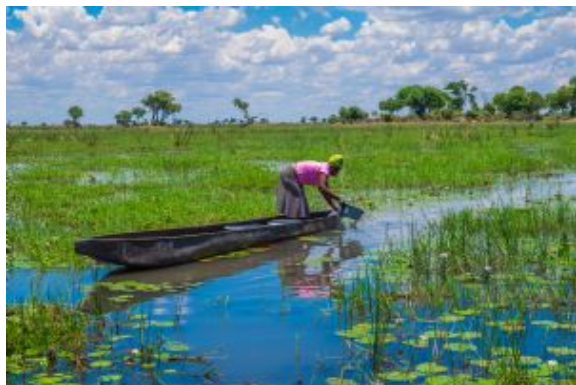
Población local en el Delta

Primero en lancha rápida y luego en canoa tradicional (mokoro) navegaremos por el delta del Okavango. Siguiendo el relajado fluir del delta, descubriremos su fauna, sus islas y sus paisajes repletos de nenúfares y papiros. Los mokoro son el medio de transporte ideal para recorrer el corazón de uno de los ecosistemas más diversos, ricos e idílicos de todo el continente pues nos permite explorar los pequeños canales que forma este espectacular delta interior.