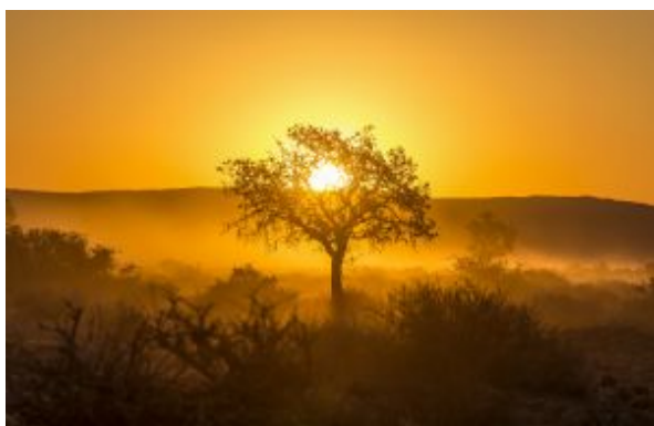
Etosha Parque Nacional

Ponemos rumbo al este de Namibia. Fuera de las tradicionales rutas turísticas nos encontramos con los últimos representantes de una cultura casi extinta, los bosquimanos. La cultura y modo de vida de los San está amenazada que se ha decidido visitar y apoyar la zona de conservación NYAE NYAE, que tiene una gestión ejemplar por permitir a los San mantener el control sobre los recursos naturales de este territorio y su utilización a través de un organismo oficialmente reconocido. Acompañamos una familia San, descendiente del pueblo más antiguo del mundo, para conocer todas sus tradiciones, su modo de vida basado en la caza y la recolección. Un intercambio muy enriquecedor y emocionante.