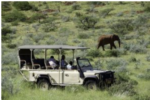
Vehículo para los safaris en Damaraland

Los viajeros de la opción clásica se alojarán en Opuwo mientras que los viajeros de la opción confort lo harán en Khorixas.