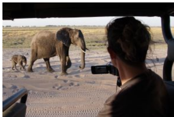
Safari en Chobe N.P.