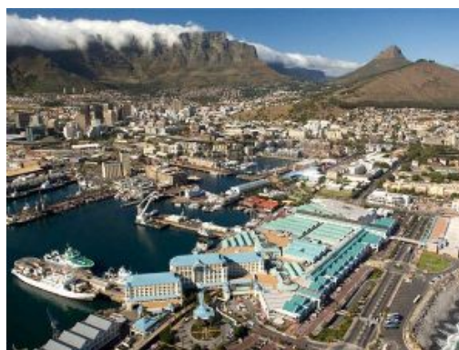
Cape Town Waterfront