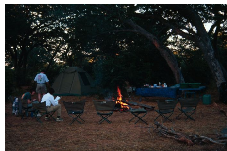
Uno de los safari camps