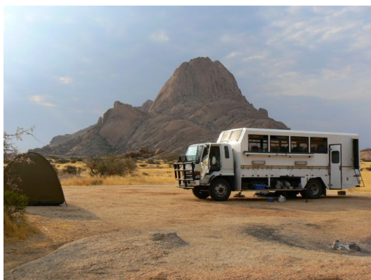
Uno de los camiones de la ruta

Una combinación pensada para maximizar la experiencia y el disfrute de los parques y paisajes.