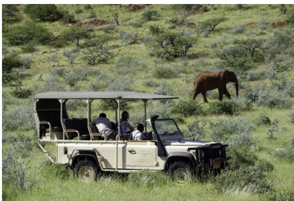
Vehículo para los safaris en Damaraland