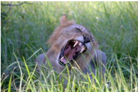
Leones en Mikumi

Distancia/Tiempo estimado de conducción: 30km / 6h30 por carretera y pistas