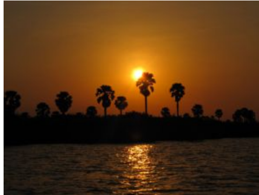
Puesta de sol en Nyerere