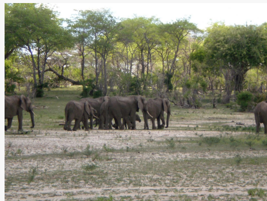
Elefantes en Nyerere