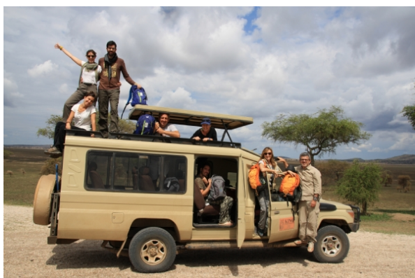
Vehículo de Safari

Los traslados desde y hasta el aeropuerto se realizarán en vehículos de uso exclusivo según tamaño del grupo. El safari se realiza en vehículos 4x4 adaptados para este tipo de actividades, con el chasis y carrocería adaptados admiten hasta 7 pasajeros, cada uno de ellos sentado junto a ventanilla. Los techos, además, son practicables para poder disfrutar de una visión de 360 °