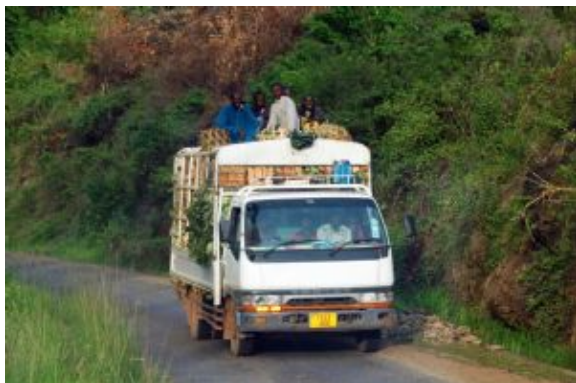
por las carreteras del sur

El Parque Nacional de Mikumi , uno de los espacios naturales más extensos y accesibles del país, forma parte del gran ecosistema de Selous que alberga una enorme diversidad de fauna. Paisajes de amplias sabanas, llanuras abiertas y colinas suaves, atravesadas por caminos facilitan la observación de animales. Aquí es común encontrar leones, elefantes, jirafas, cebras, búfalos y antílopes, además de una rica variedad de aves. El parque destaca por ofrecer una experiencia de safari auténtica y sin entornos masificados.