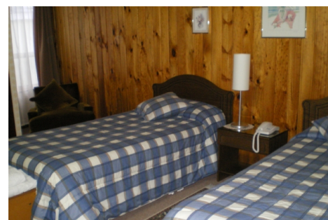
Hostería hab privadas