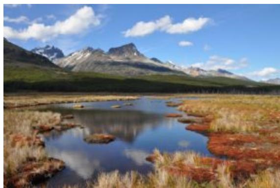
Tierra de Fuego