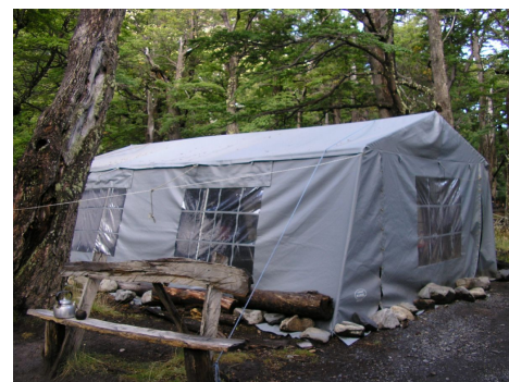
Campamento full Poncenot