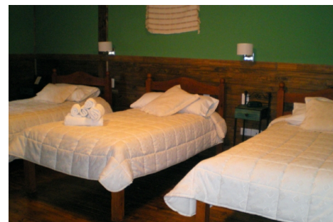
hostería hab compartidas