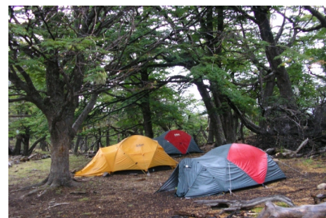
campamento full Poncenot