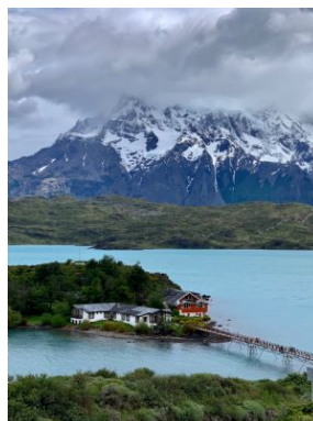
V.Crous Foto: P.N.Torres del Paine