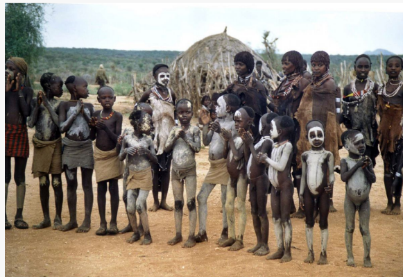
Poblado en el omo