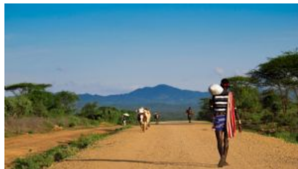
Camino al mercado