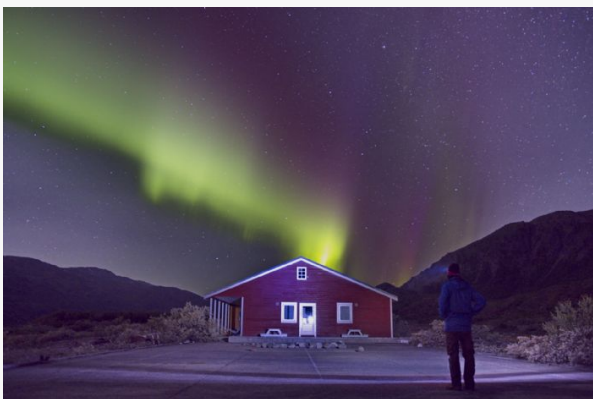
Narsasuaq Northern Lights

Entrada al Glaciar Kiagtuut , una de las lenguas de salida del Inlandis (si las condiciones lo permiten), el segundo glaciar más grande después de la Antártida.