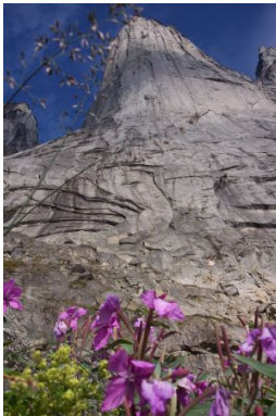
Carlos Torras Foto: el Big Wall de l'Àrtic