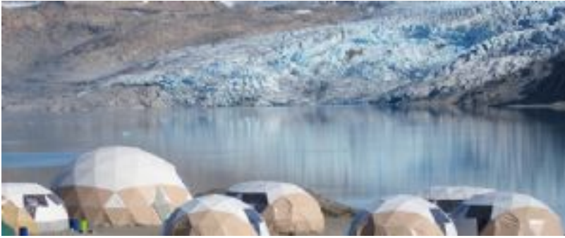
Glaciar de Qaleraliq