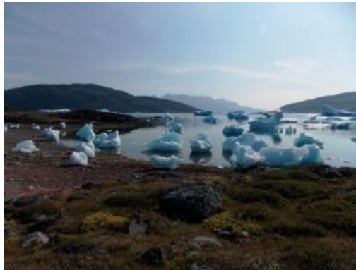
Bahía de Tassiusaq