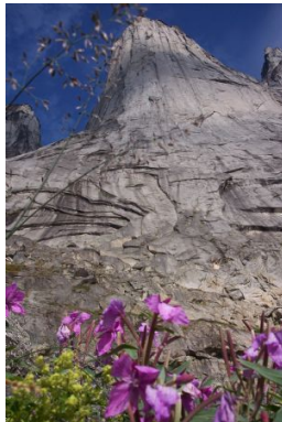
Carlos Torras Foto: el Big Wall de l'Àrtic