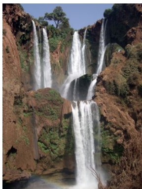
Cascadas de Ouzoud

Desayuno. Tiempo libre hasta la hora del traslado al aeropuerto y fin de nuestros servicios.