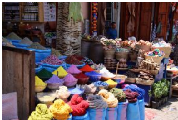
Marrakech, De mil Colores