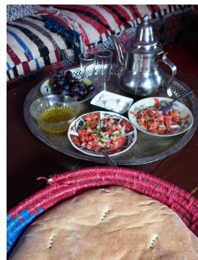
Desayuno bereber en la Gîtes d'étape