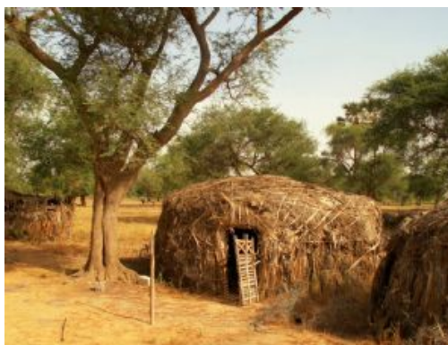
Bou el Mogdad