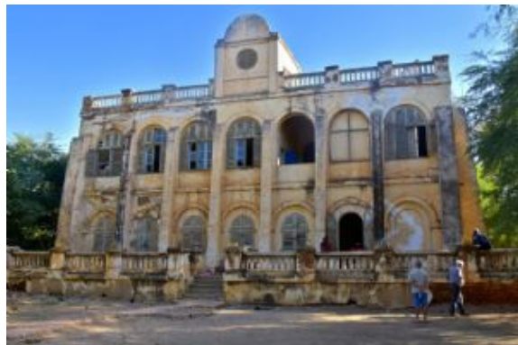
Bou el Mogdad