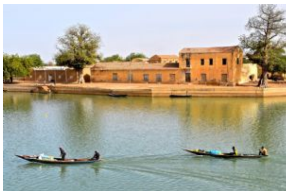
Bou el Mogdad

Salida nocturna para una cena mechoui al borde del río, iluminados por lámparas de petróleo. Noche a bordo.