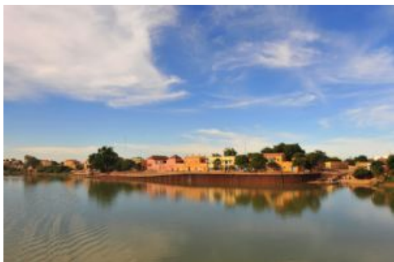
Bou el Mogdad

Tras el desayuno a bordo, desembarque y traslado por carretera a St. Louis donde llegaremos para el almuerzo. Continuación con el siguiente traslado al aeropuerto de Dakar donde finalizan los servicios. Salida de madrugada en el vuelo de regreso.