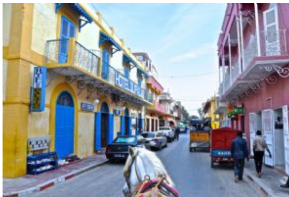
Bou el Mogdad