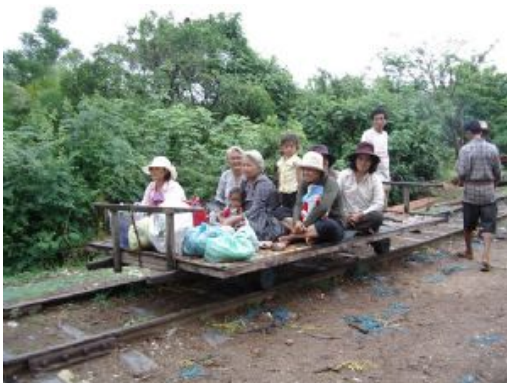
Tren de bambú