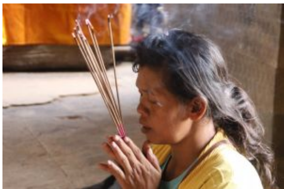
Quins llavis vols guapa