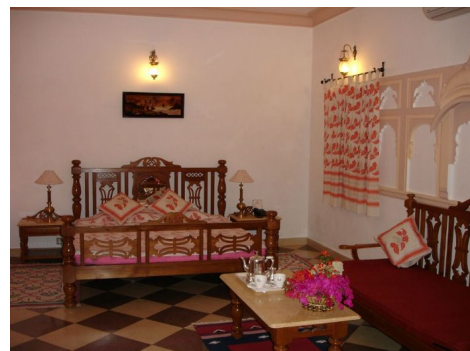
Hotel Khimsar Fort