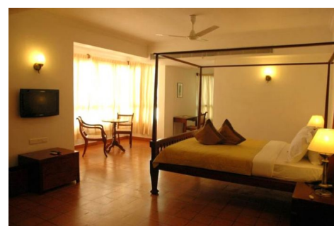
Hotel The Killians