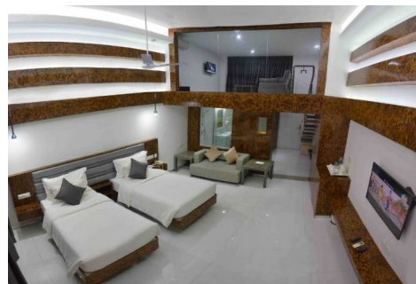
Hotel Grand Bay Hotel