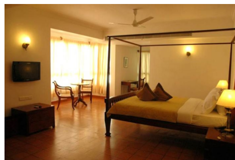
Hotel The Killians