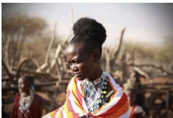
Princesa Masai y la montaña sagrada