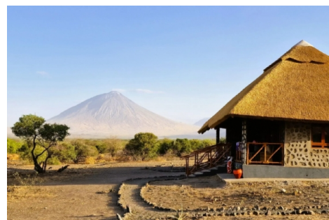
P&W Natron hotel