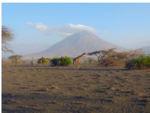
Natron Ol Doinyo Lengai