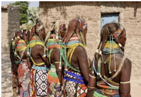
Mirador de Tundavala

Distancia: 240 km / Tiempo estimado: 4 horas