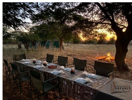
Acampada expedición sur Angola