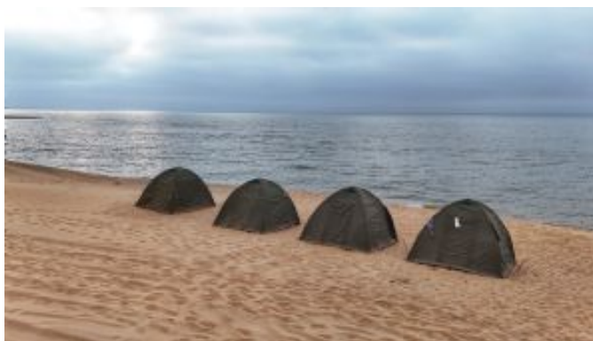
Acampada Iona National Park