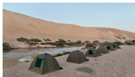
Acampada en Bahía dos Tigres

Bajo petición, el viajero que lo desee podrá solicitar una tienda de uso individual con el suplemento correspondiente. La confirmación quedará sujeta a la operativa del viaje y a la composición final del grupo.