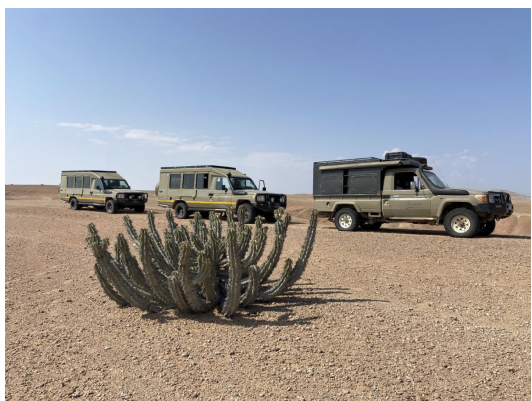
Vehículos en lona

Los traslados desde y hasta el aeropuerto se realizarán en vehículos de uso exclusivo según tamaño del grupo. La expedición se realiza en vehículos 4x4 de chasis extendido que admiten hasta 8 pasajeros, más los vehículos de apoyo logístico que variarán en función del número de viajeros.