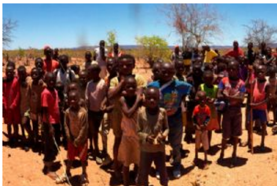
Aldea en Oncocua

Distancia: 35 km / Tiempo estimado: 1 hora 20 min