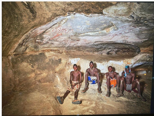
Tchitundu-Hulu, Gente Ovakuvale, Virei area