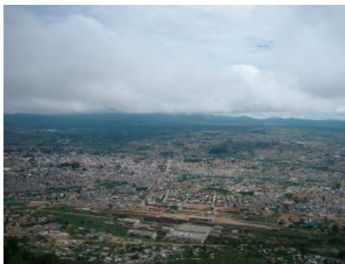
Vistas de la ciudad de Lubango