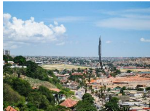
Mausuleo en Luanda