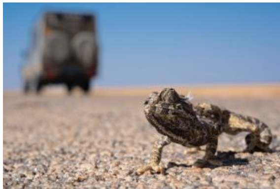
Camaleón de Namaqua, en ruta