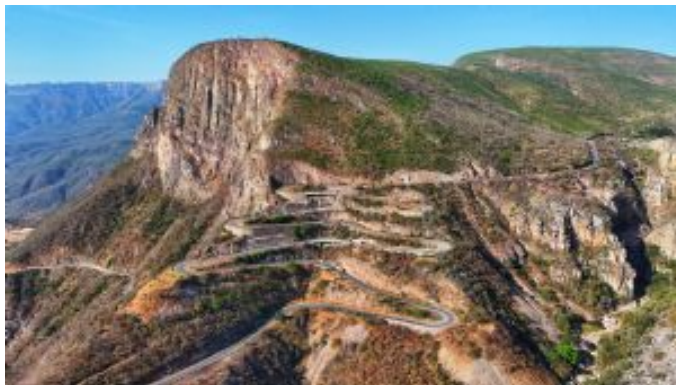
Serra da Leba