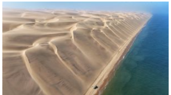
Iona National Park