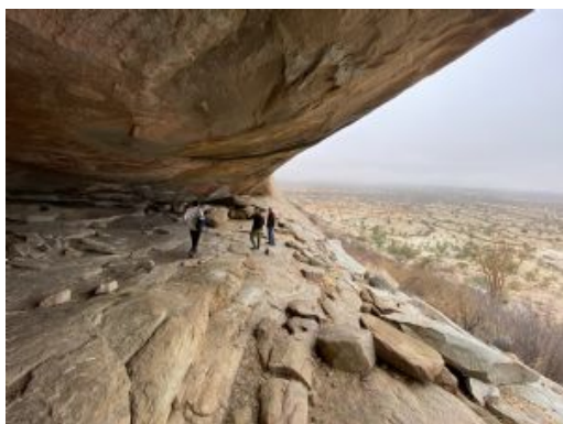
Cueva en Tchitundo Hilo

Distancia: 270 km / Tiempo estimado: 4 horas de trayecto y 3 horas de recorrido en el parque.