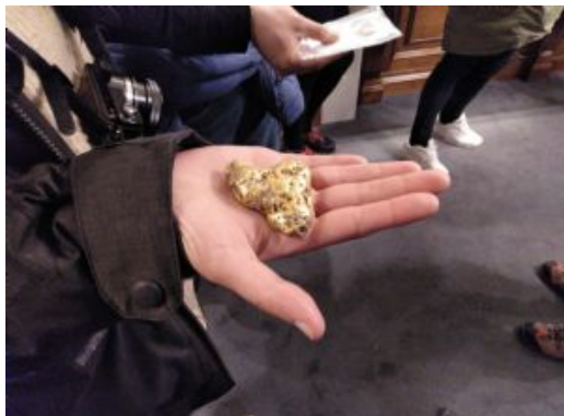
Arrowtown Pueblo minero