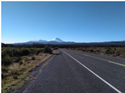
Tongariro National Park

Trayecto: 175 km + ferry / 4,5-5 h totales