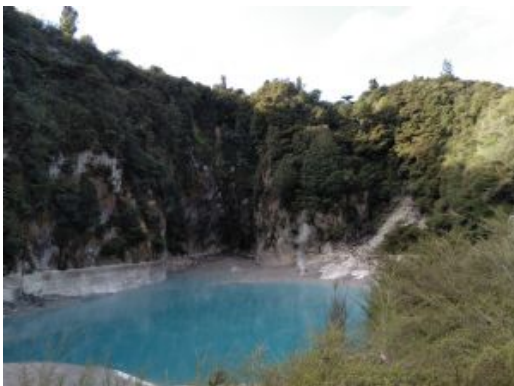
Rotorua. Waymangu Volcanic area