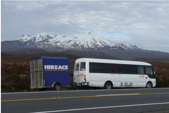
Transporte - bus - Nueva Zelanda

Diariamente se rotan asientos para que todos los pasajeros tengan la oportunidad de apreciar las mejores vistas de los asientos delanteros.