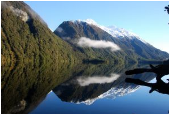
Nueva Zelanda Mirall Natural