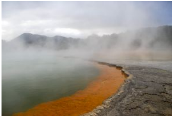
Wai o Tapu