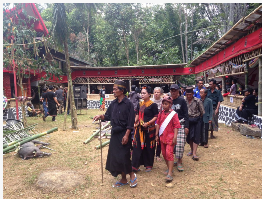
Presentando respetos en Toraja