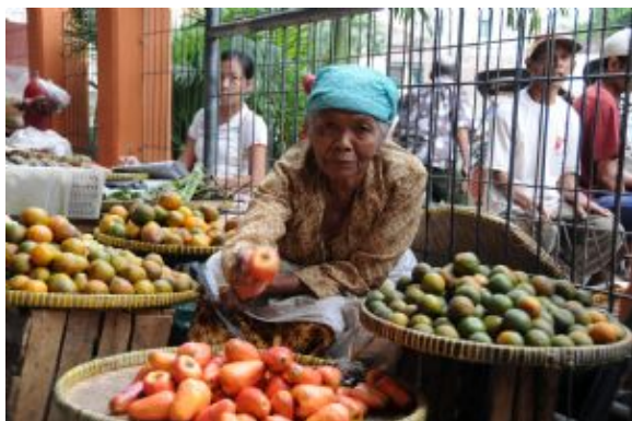
A través de Java

Importante: La entrada a Bromo ( Rp. 220.000 en días laborables y Rp. 325.000 en fin de semana y festivos) así como la subida opcional a caballo son de pago directo y no están incluidas en el precio del viaje.