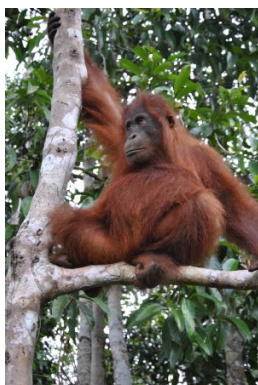
Mercè Gayà Foto: Orangután

Hoy realizamos una excursión al mundialmente famoso templo budista de Borobodur, con más 500 estatuas diferentes de Buda e infinidad de grabados de fina talla. Después visitaremos el conjunto de templos hindúes de Prambanam, el mayor santuario hinduista de Indonesia. Estos templos dedicados a Brahma, Wisnu y Shiva, la trinidad hindú. Almuerzo en una casa colonial y resto de día libre para completar por nuestra cuenta las visitas en la ciudad.