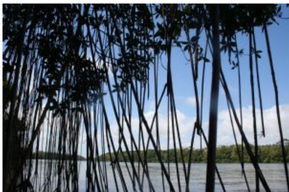
Lençóis Rio Preguiza