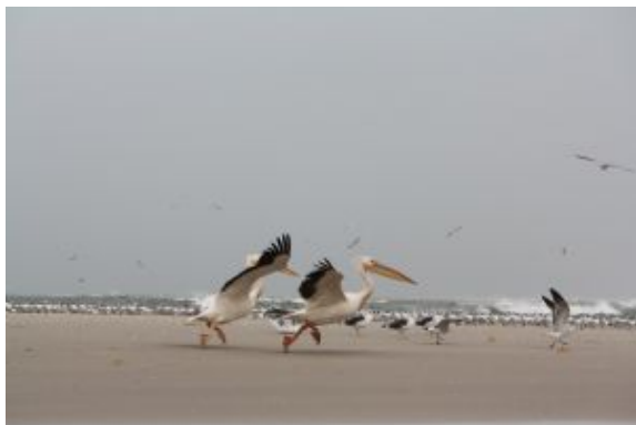
Parque de Djoudj