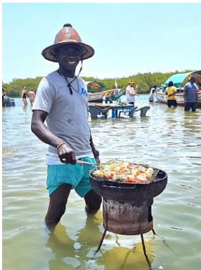
Delta del Saloum