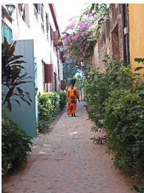
Isla de Gor