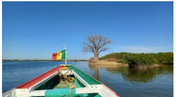
Delta del Saloum