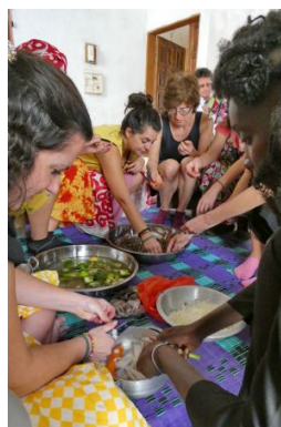
Saint Louis