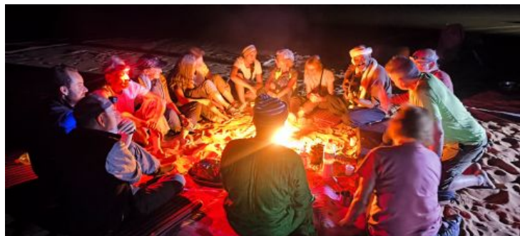
Cena en el tadrart