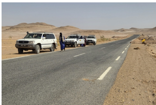
De camino al Tadrart

Los traslados en Argel y en Tipasa están también incluidos y se realizarán en minibús o autobús dependiendo del número de personas del grupo.