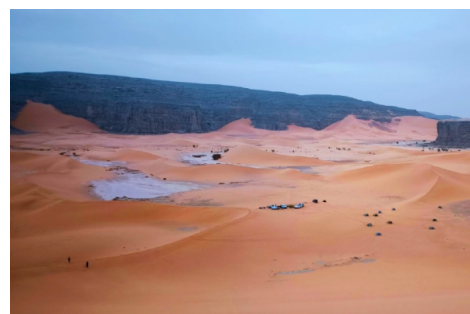
Campamento en el Tadrart