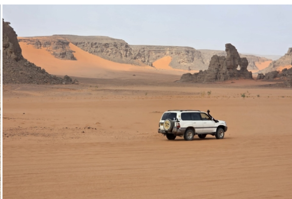
4x4 en el Tadrart