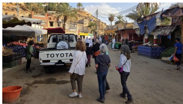
Mercado de Djanet