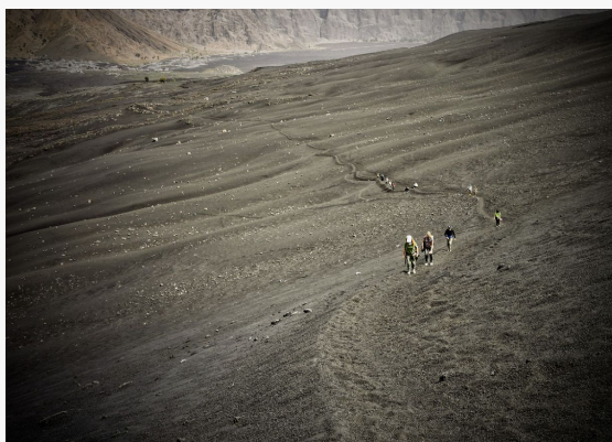
Caminata al volcan de Fogo

Aquellos que no se vean capaces de la ascensión hasta el Pico de Fogo, propondremos alternativamente la ascensión al 'pico pequeno' más asequible y con un desnivel considerablemente menor.