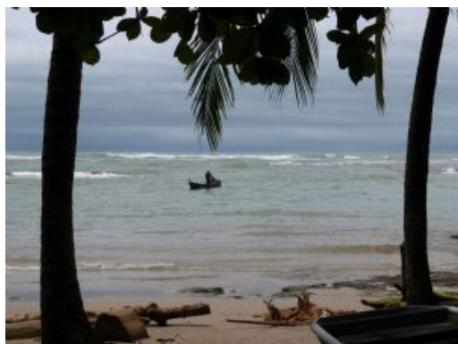
Manuel Antonio Parque Nacional