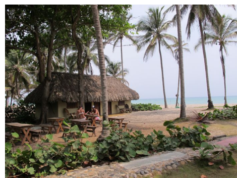
Hotel en la playa de Palomino