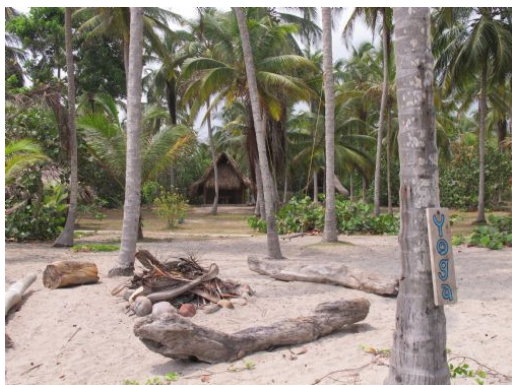
Caribe - Palomino 25