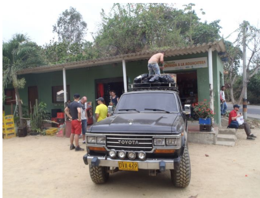
Machete Pelao. Inicio del trek

Para la extensión a la Península Guajira se utilizan vehículos 4 X 4 para atravesar el desierto.