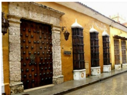
Cartagena de Indias