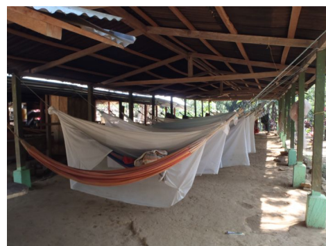
Hamacas en el Campamento Adan