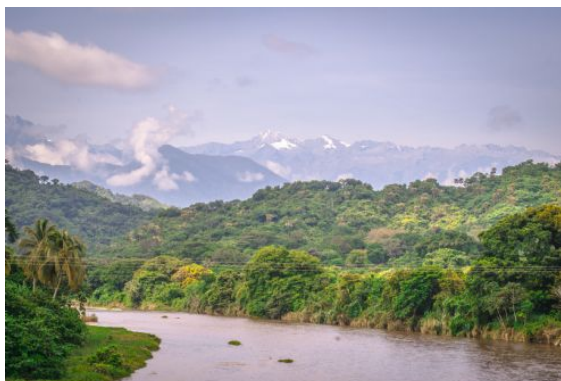
Sierra Nevada desde Tayrona