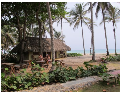
Caribe - Palomino 20