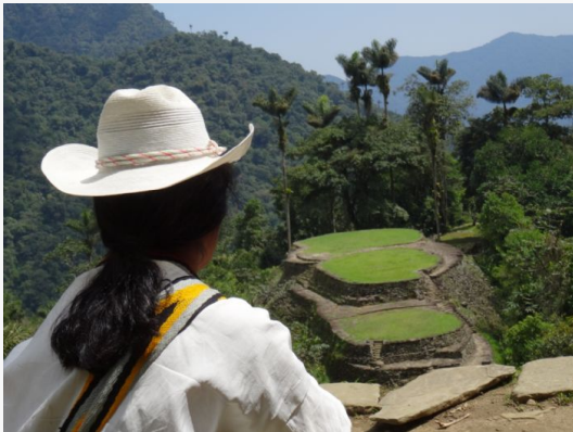
La Ciudad Perdida Teyuna

Para el trekking conviene llevar una mochila con el mínimo equipaje posible, ya que vamos a cargar con ella durante todo el camino. De modo general conviene tener en cuenta que la posibilidad de lluvia es alta, que el barro y la humedad son una constante y que la caminata discurre por montañas cubiertas por una densa selva tropical. Además de la ropa y los complementos personales de cada uno, es imprescindible llevar: Unas buenas botas de trekking impermeables, unas zapatillas ligeras o sandalias para cuando nos quitemos las botas, capa para la lluvia, bañador y toalla, saco-sabana para las noches, repelente de mosquitos, bolsas de plástico para la ropa seca, papel higiénico, linterna, protección para el sol y cantimplora.