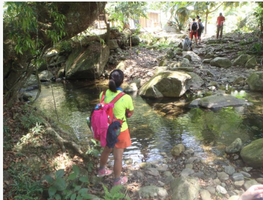
En el camino