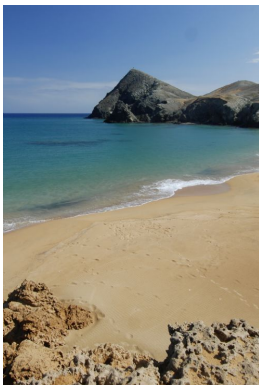
Peninsula Guajira_Cabo de la Vela

Por la tarde, ascenso al Pílon de Azúcar, una colina sagrada conocida como Jepirra por los indígenas Wayúu. Según su cosmovisión, este es un lugar de tránsito espiritual: el punto donde las almas de los fallecidos emprenden su viaje hacia otra vida, cruzando los vientos y territorios sagrados de Makaichi. Desde la cima, contemplaremos un atardecer inolvidable, con el mar Caribe y el desierto fusionándose en el horizonte.