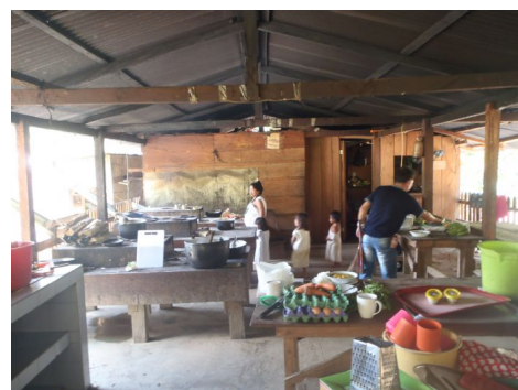
Cocina en el campamento