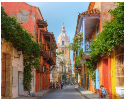
Cartagena de Indias