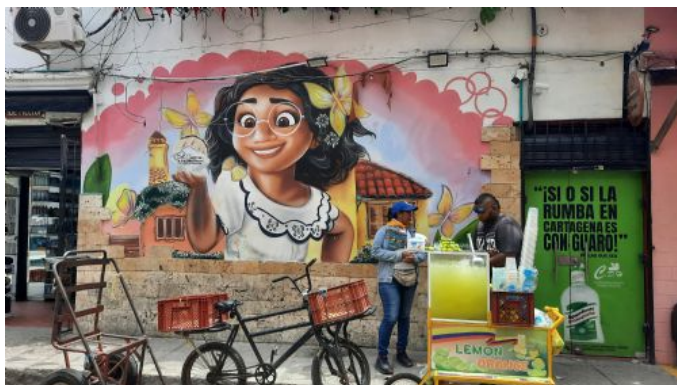
Cartagena de Indias

Llegada a ciudad de origen. Fin de nuestros servicios.