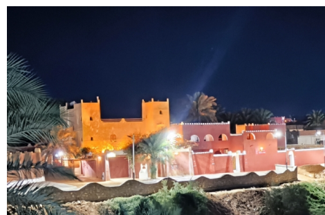
Résidence Akham, Timimoun