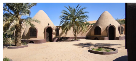
Mille et une nuits Taghit