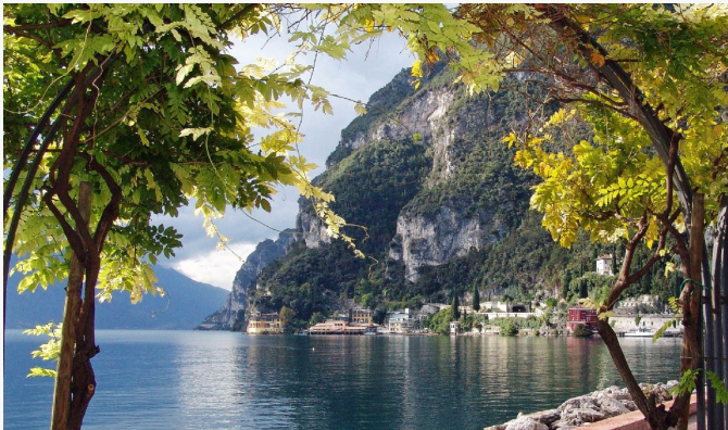
Lago di Garda

Un recorrido por la orilla del lago nos acerca a paisajes donde la naturaleza nos hace sentir minúsculos, recorriendo la carretera de un sólo sentido que conecta los pueblos que se asoman a sus aguas. Al norte, el Garda Trentino, y particularmente las poblaciones de Riva del Garda, Torbole y la playa del Arco, son el paraíso de los deportes acuáticos, y donde se practica vela y windsurf con pasión. Aquí comienza la Riviera degli olivi, donde abundan las ensenadas que son como miradores al lago, acompañadas de preciosos pueblos con castillos.