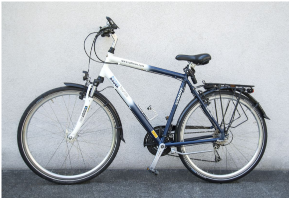
Bici Lago di Garda