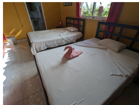
Casas particulares - Viñales