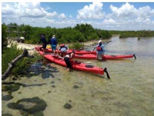
Salinas de Brito