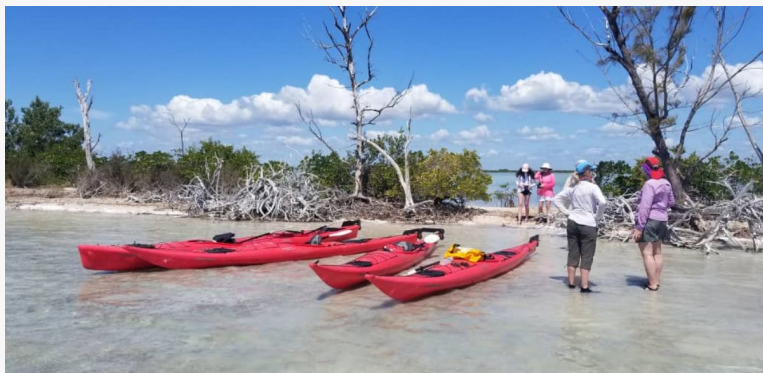
Kayak en Cienfuegos

Recorrido de mañana por el Malecón y las avenidas de La Habana en un coche clásico americano descapotable de los años 50 (que aquí reciben el nombre de “almendrones”).