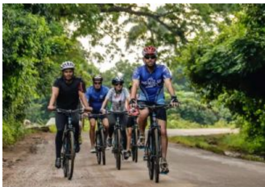
Habana en bicicleta

Excursiones y visitas: Visita de los barrios de la Habana en bicicleta (aprox. 2 h.)