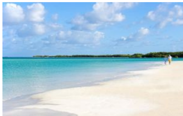
Cayo Santa María