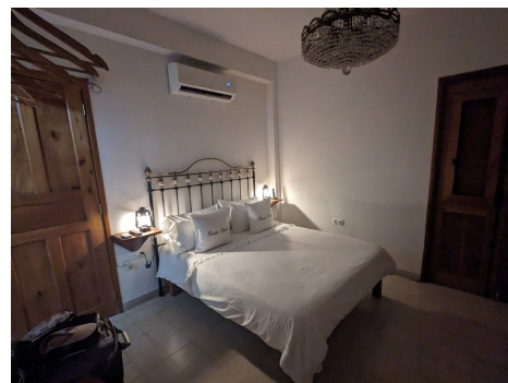
Casas Particulares - La Habana