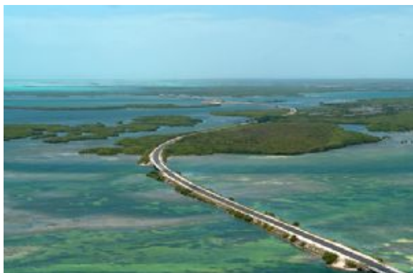
Cayo Santa María carretera