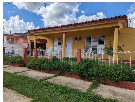
Casas particulares. Viñales

Para evitar pérdidas de tiempo y que el viajero no tenga que preocuparse de la logística más allá de lo razonable, en el viaje incluye diversas comidas en establecimientos seleccionados. Se intenta alternar comidas preparadas en las casas donde nos alojamos con restaurantes locales (paladares) de manera que exista una cierta variedad. En algunas excursiones se facilita comida pic-nic