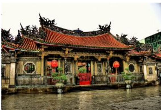
Taipei, Mengjia Longshan Temple