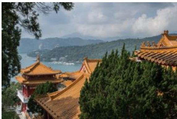
Sun Moon Lake Temple