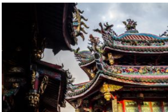
Taipei, Mengjia Longshan Temple