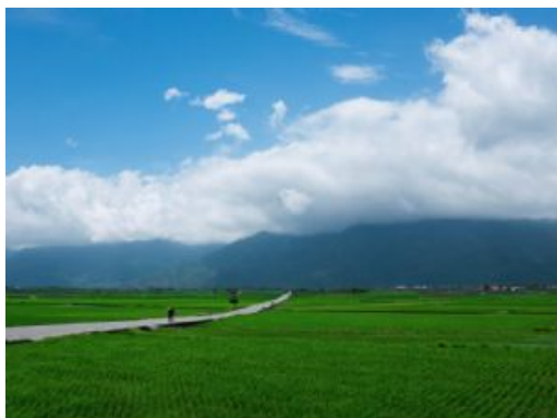
Chishang, rice fields