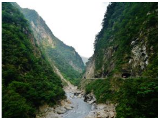
P.N. Taroko falls river