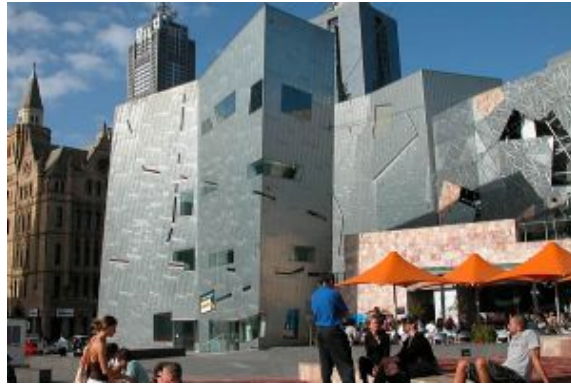
Melbourne Federation Square