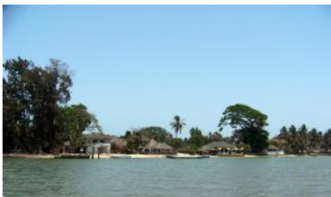
Casamance_Carabane_poblado en la costa