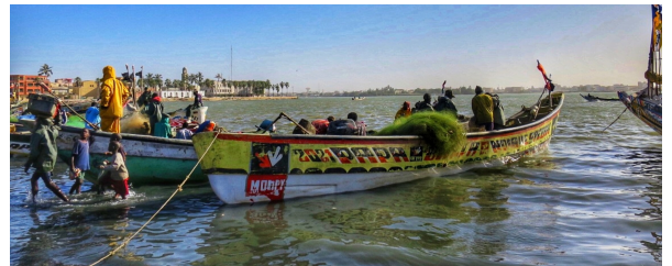
Autor: Marisa Maurel