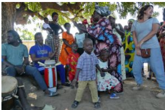
Los mejores tambien bailan