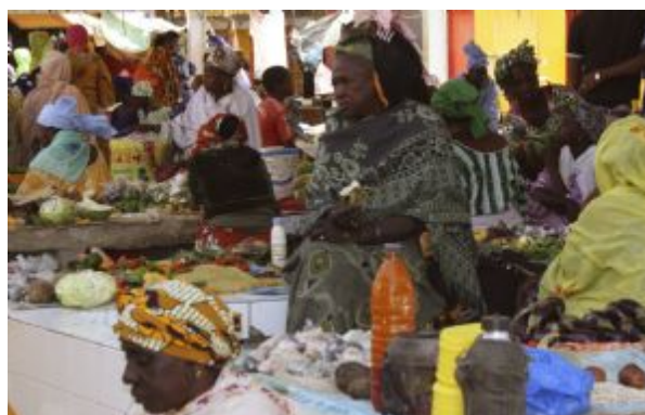
Gente. Poblacion local