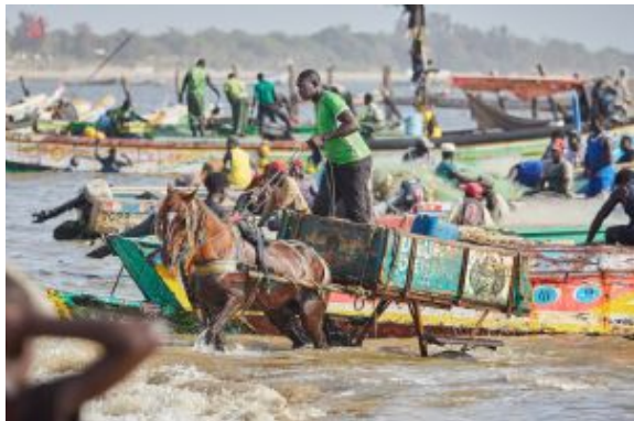
Comprar peix 1

Tiempo libre hasta la hora indicada para el traslado al aeropuerto y fin de los servicios.