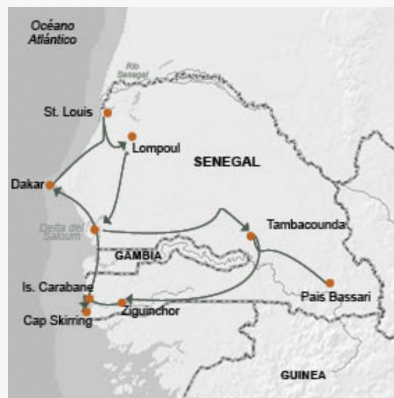
Ruta de 15 días, País Bassari y Casamance Autor: