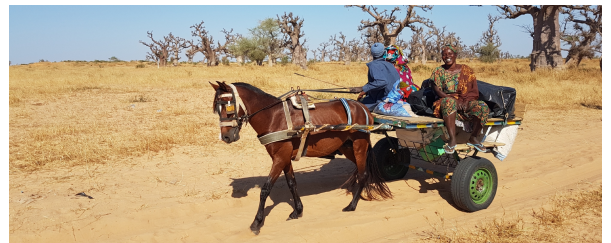
Autor: Miquel Pujadas