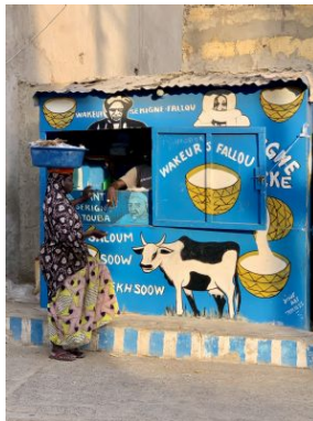
Autor: Miren Lopez de Foronda