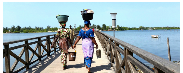
Autor: Archivo Tuareg