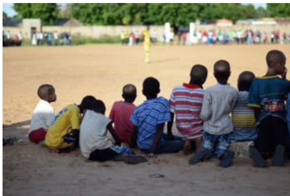
Gorée isla 4