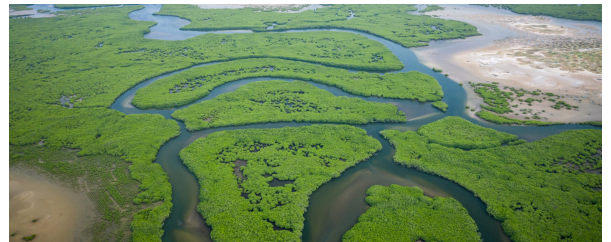
Autor: Archivo Tuareg