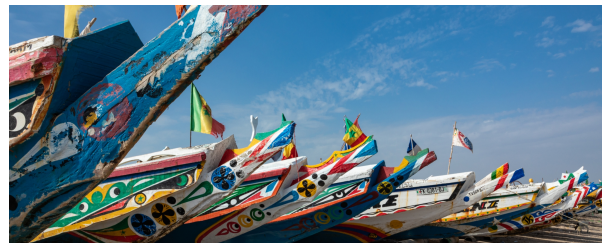
Autor: Archivo Tuareg