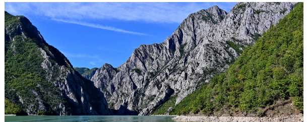
Autor: Luis Alberto Benito