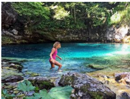
Valle de Theth