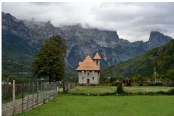
Iglesia Valle de Theth