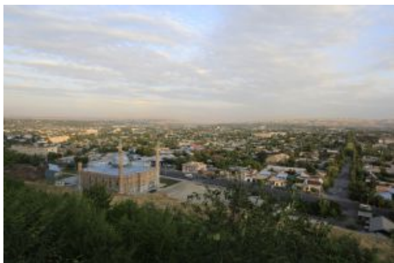
Ak Sai Travel