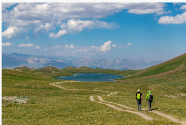
Trekk Tulpar Kul