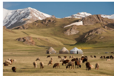
Yurtas Son Kul