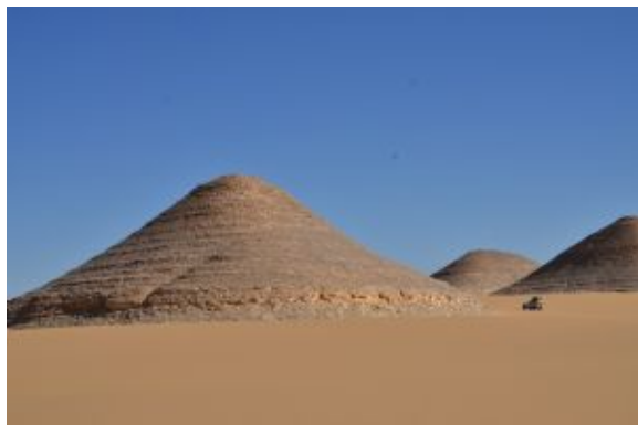
Pista Abu Minqar

Recorrido: 250 km por pistas/ 6 horas ruta con paradas.