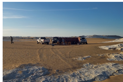
Nuestro campamento en el desierto