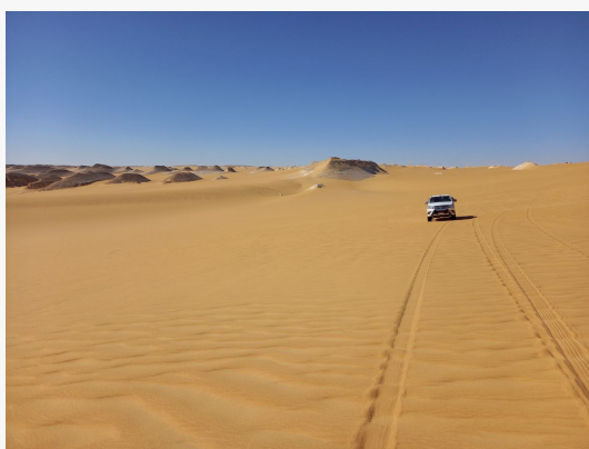
Gran Mar de arena

En resumen, un viaje sin excesivas complicaciones, diseñado para un amplio espectro viajero, que nos lleva a conocer algunos de los lugares más espectaculares del Sahara oriental . Si disfrutaste de los Tassilis de Argelia y de los oasis del sur de Libia, este viaje no te decepcionará; y si es tu primer viaje al desierto, el entusiasmo está prácticamente asegurado