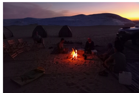
Alrededor del fuego