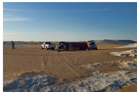
Nuestro campamento en el desierto