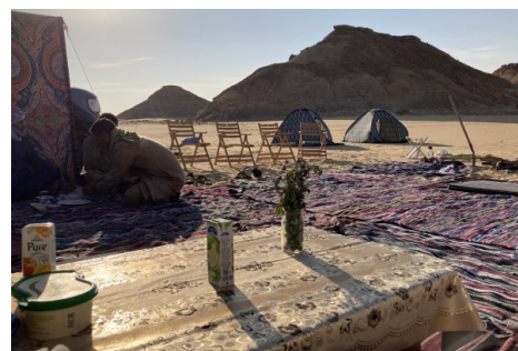
Preparando el desayuno