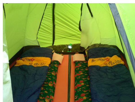
Campamento de Kel Suu