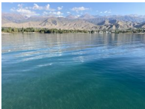
Issyk Kul lago