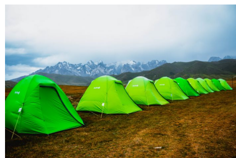
Kel Suu Lago