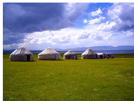
Yurtas Son Kul Camp