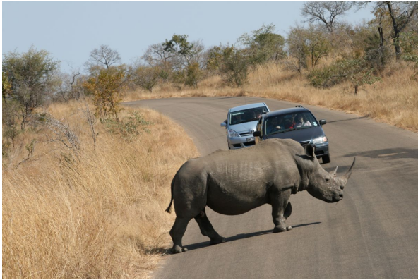
Cedan el paso