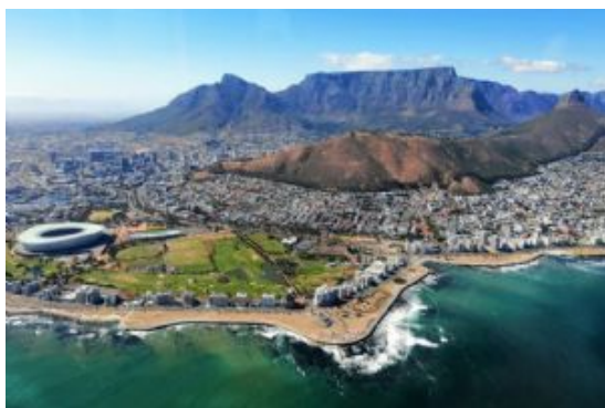
Sud áfrica - Ciudad del Cabo

Llegada al alojamiento, check-in y resto de día libre a disposición para empezar a conocer la "Ciudad Madre", probablemente la ciudad con más carácter europeo de todo el país.