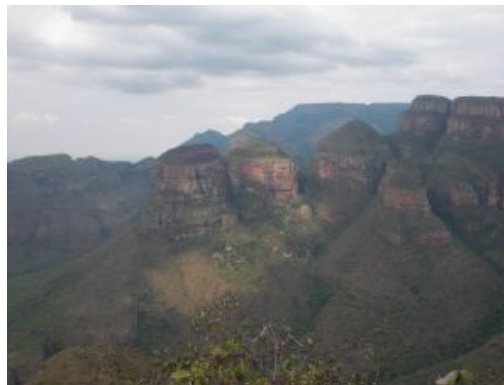
Mercè Gaya Autor:Blyde River Canyon_Mpumalanga_The Three Rondavels