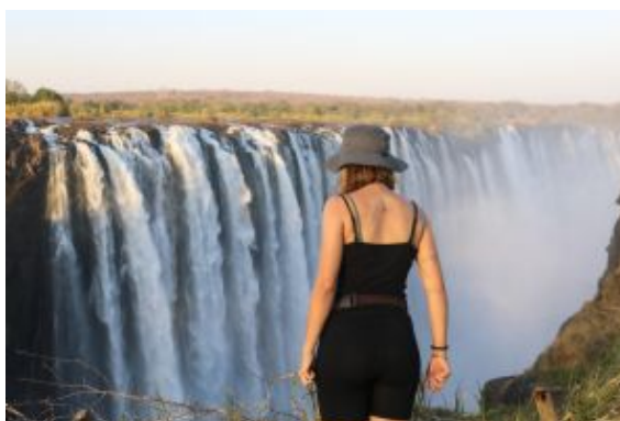
L'abisme de les Cascades Victoria