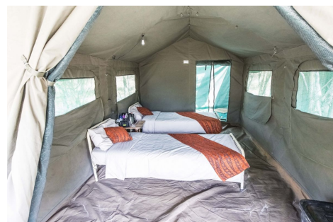
Interior tienda safari móvil