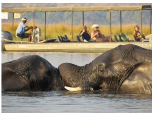
Chobe Safari Cruise

Desayuno y traslado por carretera cruzando la frontera con Zimbabwe al hotel en Victoria Falls. Por la tarde visita guiada a las Cataratas Victoria.