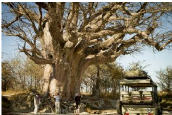
Baobabs de Baine

Desayuno y salida hacia nuestro campamento en Moremi donde llegamos a tiempo para almorzar. Por la tarde saldremos a explorar Moremi realizando nuestro primer safari por la reserva. Cena en el campamento.