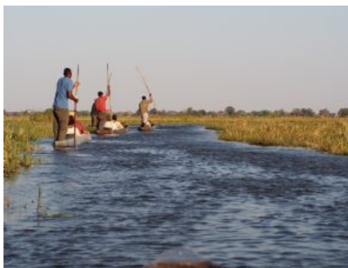
Delta del Okavango