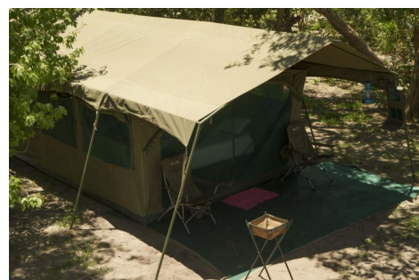
Tiendas campamento móvil