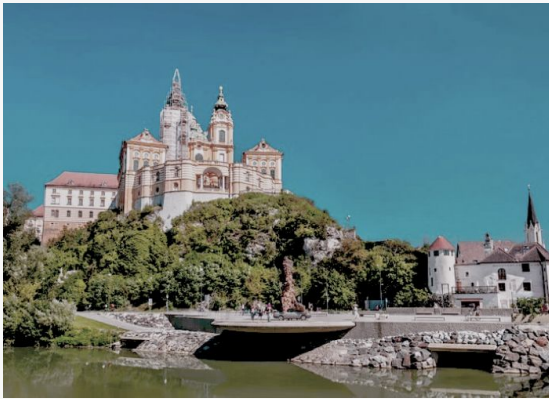
Abadía de Melk