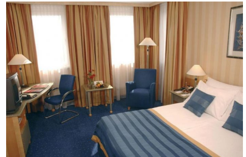
NH Danube City Hotel in Viena