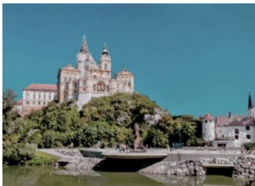
Passau - Viena