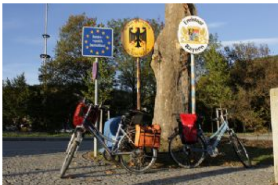
Passau - Viena