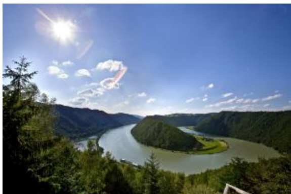
Viena - Budapest