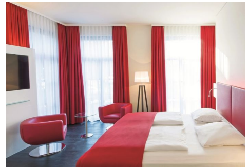
Dormero Hotel in Passau

Estos hoteles disponen de todas las facilidades, además de un lugar seguro para guardar nuestras bicicletas durante la noche.