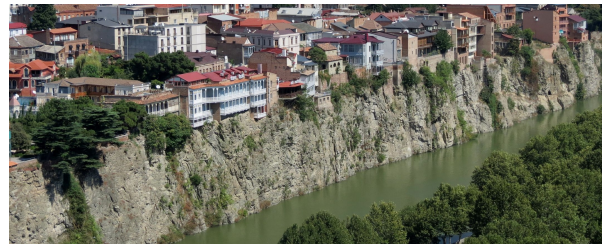
Autor: Angeles Gutierrez