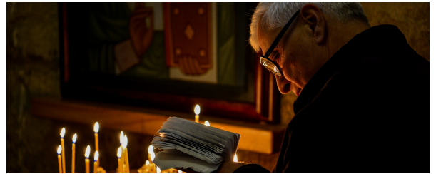
Autor: Luis Alberto Benito