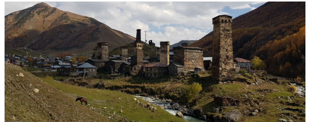
Autor: Joan Bartomeu