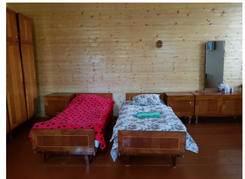
Alojamiento - Casa Rural