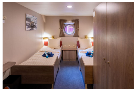
Plancius cabina doble