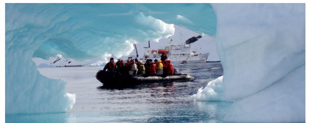
Autor: Patricia A Iglesias