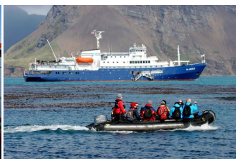
Autor:Tim Fisher M/V Plancius