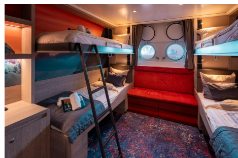
Hondius cabina cuadruple