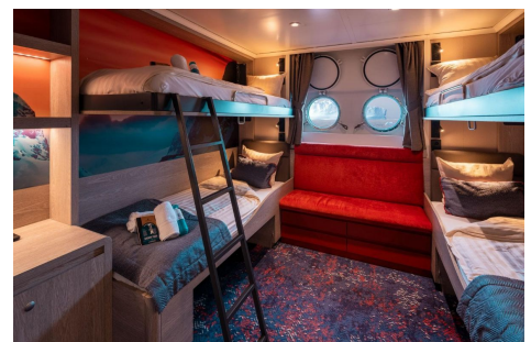
Hondius cabina cuádruple