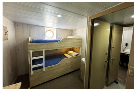
A bordo del Ushuaia