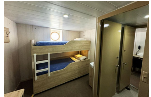
A bordo del Ushuaia

- Plancius, Ortelius y Hondius - Doble ojo de buey, 2 camas bajas, exterior y baño privado