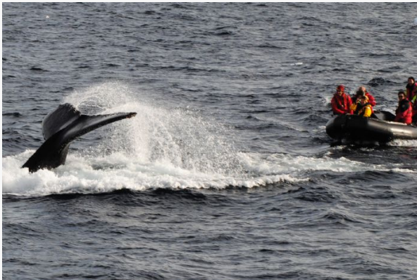
Ballena y Zodiac

Un equipo de especialistas ofrece un completo programa de charlas sobre la exploración polar y el ecosistema ártico. Y también está a disposición del viajero para cualquier consulta o para ayudarle a identificar desde cubierta las aves marinas que navegan junto a nosotros. La política de “puente abierto” permite acompañar a los oficiales en el puente compartiendo el manejo del barco y la navegación