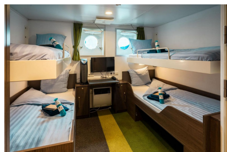
Ortelius cabina cuadruple Autor:Ocean Wide Expeditions