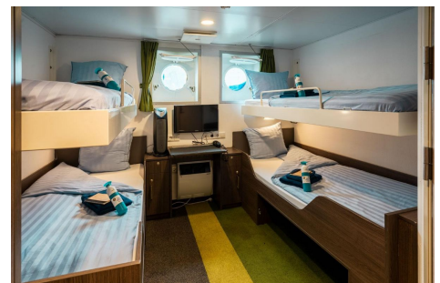
Ortelius cabina cuádruple