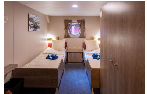
Plancius cabina doble