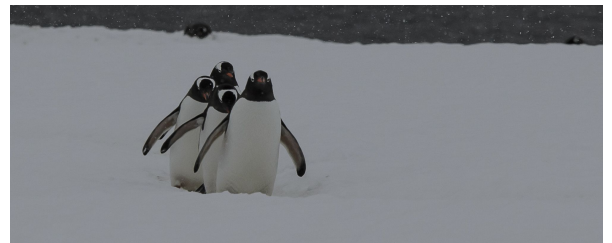
Autor: Carlos Clerencia