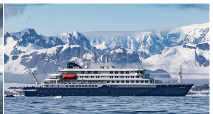
Autor:Ocean Wide Expeditions Hondius