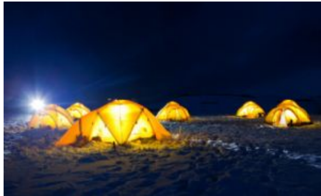
Base Camp 8