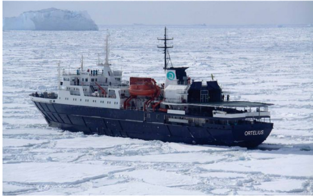
Autor: Oceanwide Expeditions