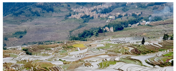
Autor: Joan Bartomeu