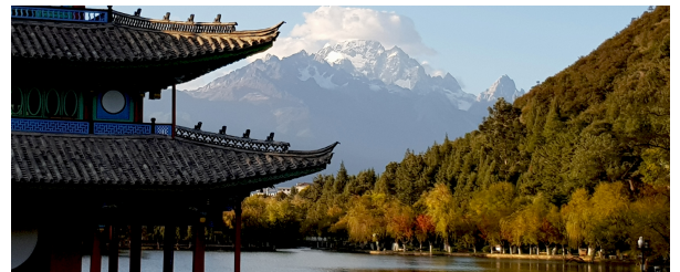
Autor: Joan Bartomeu