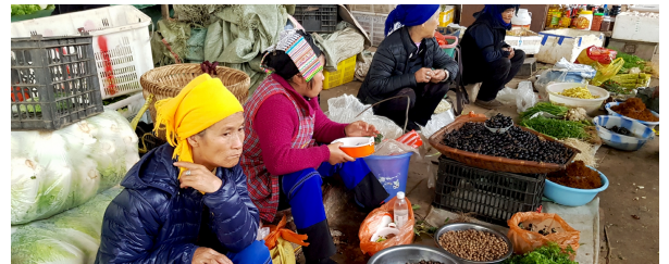
Autor: Joan Bartomeu