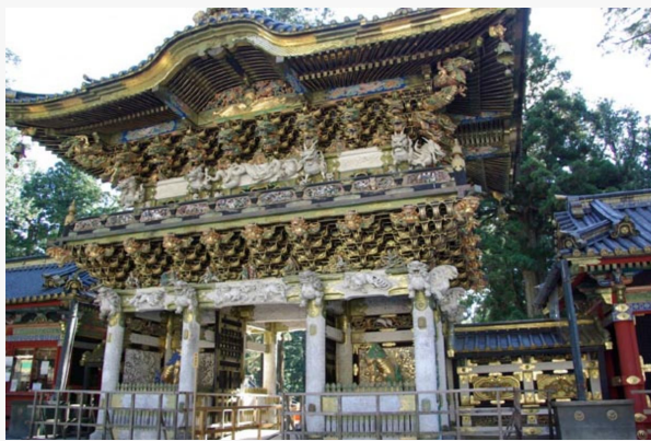
Nikko. Templo Toshogu

Notas: Estos precios incluyen medio día de visitas con traslados y guía de habla hispana privados grupo Tuareg. No incluye almuerzo.