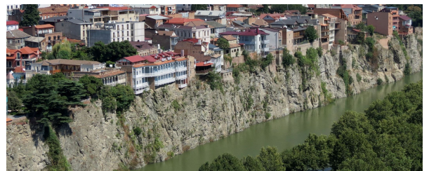
Autor: Angeles Gutierrez