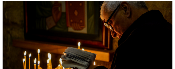
Autor: Luis Alberto Benito