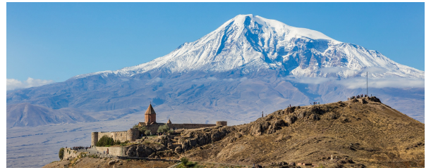
Autor: Diego Delso