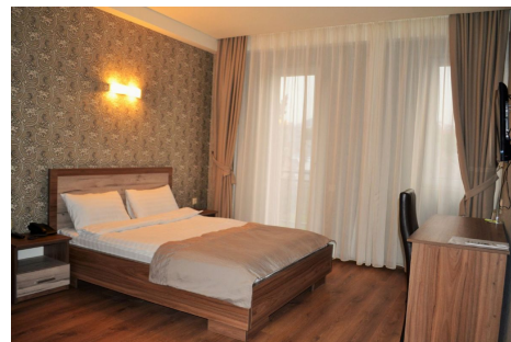
Hotel Gureli, Tbilisi

Por otro lado, en estas casas se come lo que cocinan sus propietarios que son a base de productos preparados de forma tradicional. La rica gastronomía georgiana y Armenia, es un aliciente para este viaje.