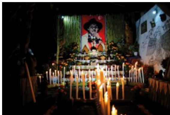
Altar Día de Muertos