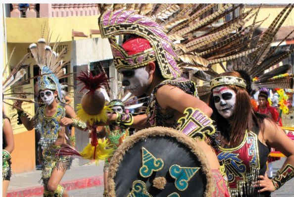
Celebración día de muertos