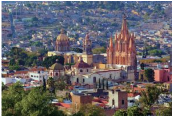
San Miguel de Allende