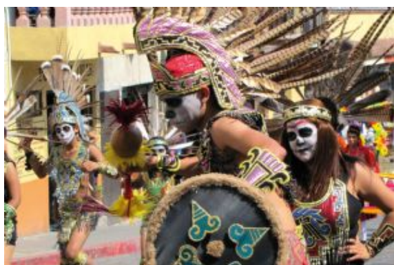
Celebración día de muertos